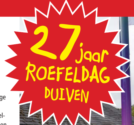
De dag begint met het hijsen van de Roefelvlag door de burgemeester met de jonge van de dag!